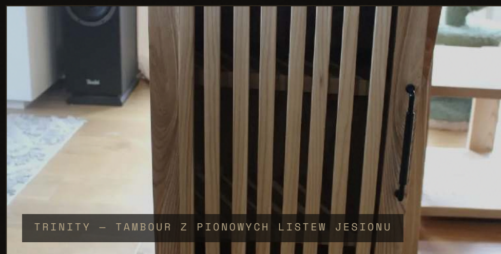
TRINITY – TAMBOUR Z PIONOWYCH LISTEW JESIONU