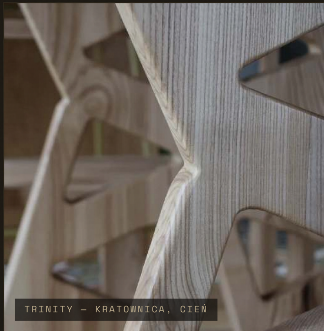
TRINITY – KRATOWNICA, CIEN