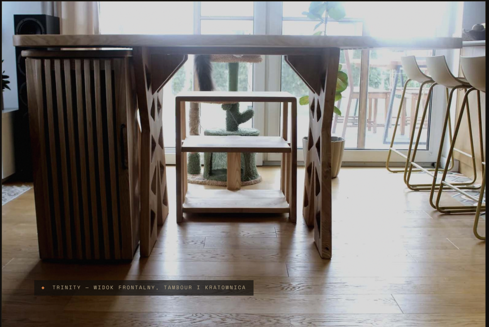
◆ TRINITY – WIDOK FRONTALNY, TAMBOUR I KRATOWNICA