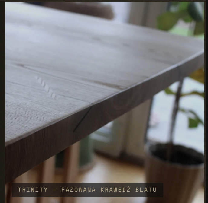
TRINITY – FAZOWANA KRAWĘDŹ BLATU