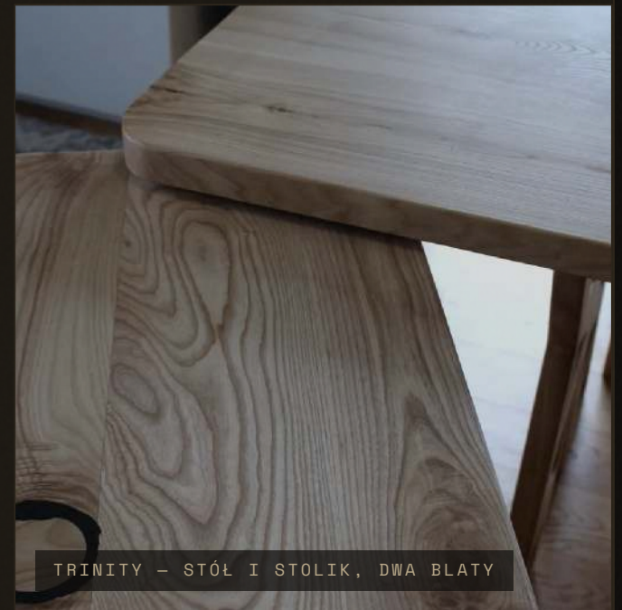
TRINITY – STÓŁ I STOLIK, DWA BLATY