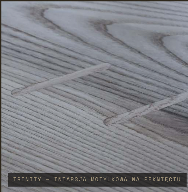
TRINITY – INTARSJA MOTYLKOWA NA PĘKNIĘCIU