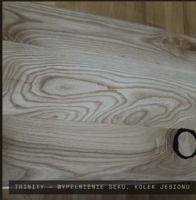
TRINITY – WYPEŁNIENIE SĘKU, KOŁEK JESIONU