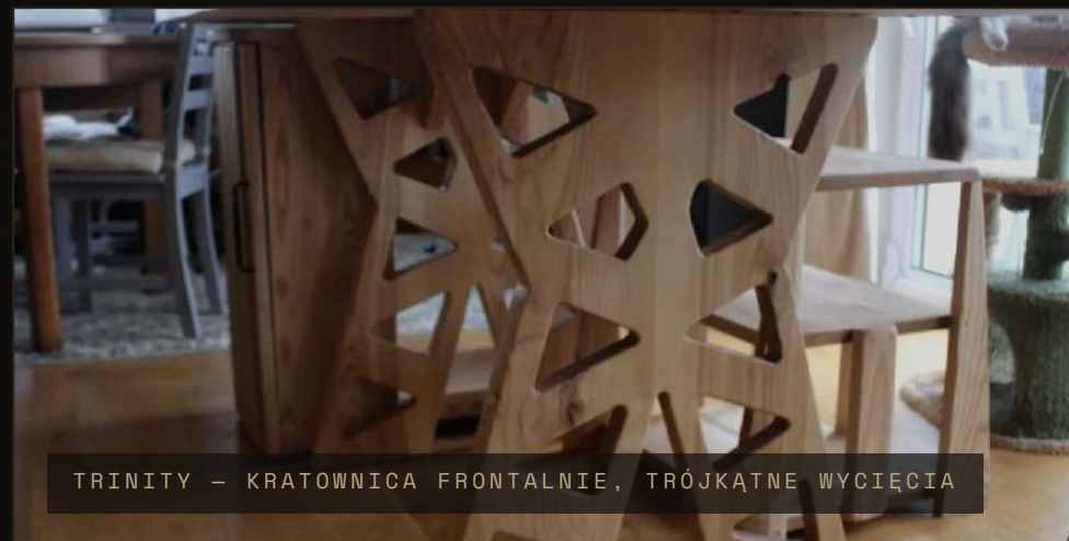
TRINITY – KRATOWNICA FRONTALNIE, TRÓJKĄTNE WYCIĘCIA

Sęk w stoliku wypadł. Chciałem zostawić dziurę. Klient nie chciał. Zakryłem kołkiem z jesionu, po bokach czarne wypełnienie. Wyszło jak zaćmienie.